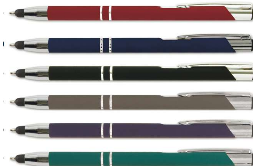
Stylo Finition Gomme

Référence ZVBLANCP0283 Tarif 1.15 HT pce Gravure couleur blanche Minimum 100 pcs Couleurs assorties Taille 15cm