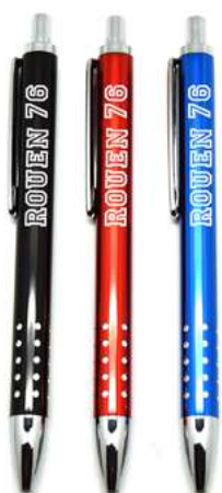
Stylo Métal avec Strass

Référence ZVBLANCP0167 Tarif 0.90 HT pce Gravure couleur blanche Couleurs assorties Minimum 72 pcs Taille 15cm