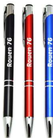
Stylo Métal avec Strass

Référence ZVBLANCP0168 Tarif 0.90 HT pce Gravure couleur blanche Couleurs assorties Minimum 72 pcs Taille 15cm