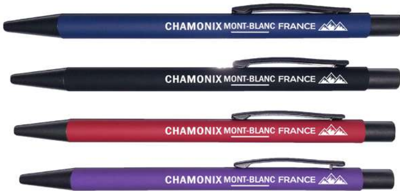
Stylo Finition Gomme

Référence ZVBLANCP0179 Tarif 2.60 HT pce Gravure couleur noire Minimum 72 pcs Taille 15cm