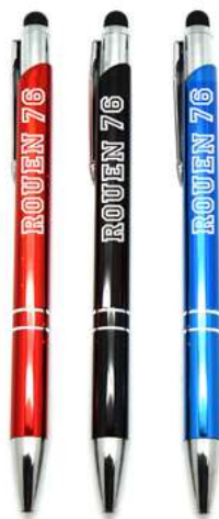
Stylo Métal avec stylet

Tous nos stylos sont équipés d'une encre de qualité et pour une longévité accrue. La majorité des modèles peuvent accepter une nouvelle recharge d'encre pour une solution durable.